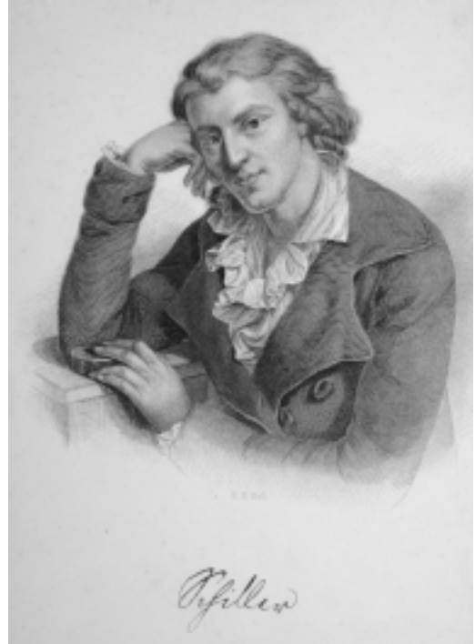
Friedrich Schiller. Stich nach dem Gemälde von Anton Graff von 1786/91