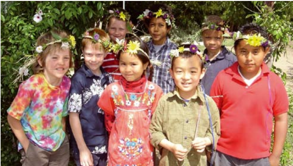
Maifeier 2006, Kalifornien

Da in Los Angeles die Rosen noch im Dezember blühen und im Februar schon wieder, ist die Schule Ostern mit einer wunderbar blühenden weißen Rosenhecke umgeben und ein duftender Jasminstrauch begrüßt einen lieblich, wenn man durch das Tor in den Schulhof tritt. Das ehemals etwas trostlose Schulgrundstück ist durch viel Elternarbeit mit Fruchtbäumen, Laubbäumen und Nadelbäumen bepflanzt worden und dadurch zu einer schattigen Oase inmitten einer Millionenstadt geworden, ohne im mindesten exklusiv zu wirken. Da einige der Kinder Vor- und Nachbetreuung brauchen,