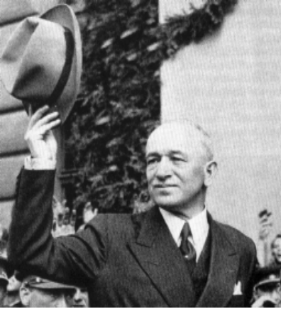
Eduard Benes, 1884-1948