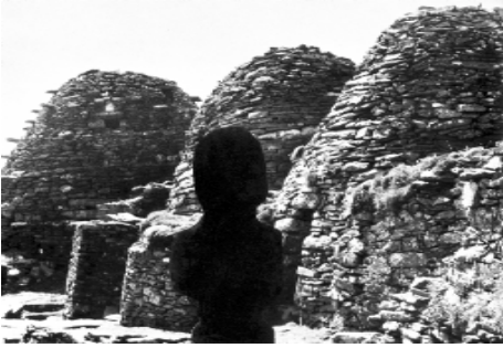
Skellig Michael, »Bienenkörbe« (aus: Jakob Streit, Sonne und Kreuz, Stuttgart 2001; Foto von Hanspeter Lieberherr)