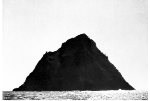
Skellig Michael (aus: Jakob Streit, Sonne und Kreuz, Stuttgart 2001; Foto Commissioners of Public Works in Ireland)