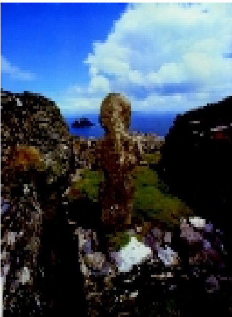
Skellig Michael, Klostersiedlung (aus: Wolfgang Ziegler, Irland. Kunst, Kultur und Landschaft, Köln 1990)

schlossener Raum, der Gefühle von Innerlichkeit und Versenkung beförderte. Gleichzeitig aber war der Kontakt zur Natur niemals abgeschnitten. Die hier praktizierte Andacht bestand nicht mehr – wie bei den heidnischen Kultstätten – aus dem Mitvollzug der Gestirnszyklen und Jahreszeitenwechsel, sondern war stärker auf das eigene Ich bezogen, das mehr ist als reine Naturkausalität.