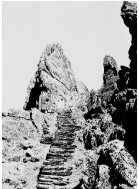
Skellig Michael, Treppenaufgang zur Klosteranlage (aus: Jakob Streit, Sonne und Kreuz, Stuttgart 2001; Foto von Hanspeter Lieberherr)