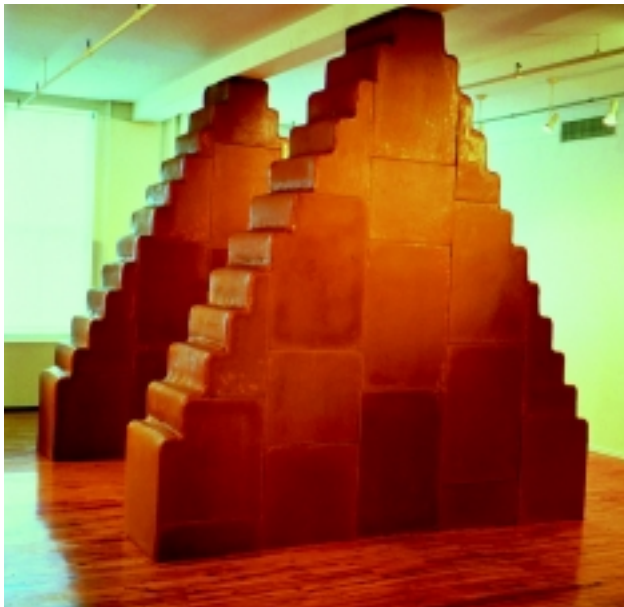
Nowhere – Everywhere, 1998. Zwei Bienenwachs-Zikkurats auf Holzkonstruktion, 386 x 373 x 75 cm