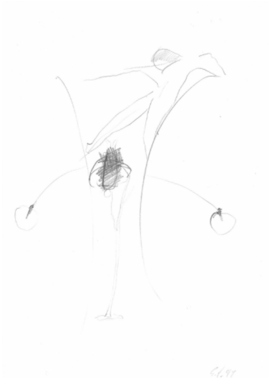
Enno Schmidt: Zeichnung, 1991. Bleistift auf Papier, 21x29,7 cm