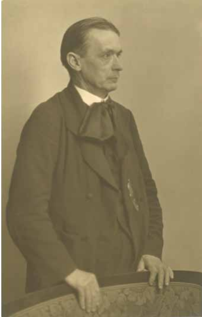
Rudolf Steiner, 1923