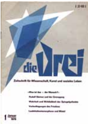
Januar 1970; Gestaltung: Walther Roggenkamp